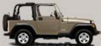
Light Khaki Metallic