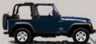
Midnight Blue Metallic