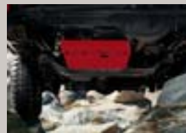
Schutzplatte Schützt die Ölwanne bei harten Offroad-Einsätzen, für 2,4 l Motor, auch für 4,0 l erhältlich, Artikel-Nr. 82206335