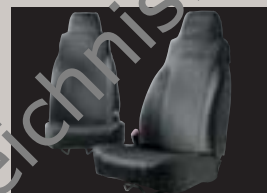
Sitzbezüge Schwarz, für vorne, robust und schmutzabweisend, mit Jeep Logo, auch für hinten lieferbar, Artikel-Nr. 82207789