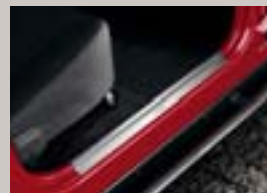
Einstiegsleisten Set für vorne. Edelstahl, mit eingefasstem Jeep® Logo, Art.-Nr. 82204262