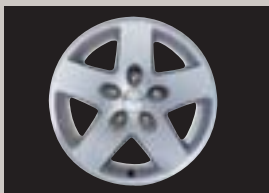
Leichtmetallfelgen 8 x 16, Typ „Rubicon“ für Bereifung 245/75 R16, Artikel-Nr. 5HP23PAKAA