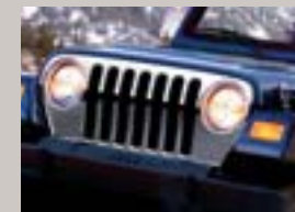
Chromgrill Kompletter Kühlergrill zum Austausch gegen Originalteil, Artikel-Nr. 82208626