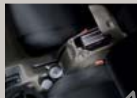
Mittelkonsole Farbe „Khaki“, mit Schloss, auch in „Dark Slate“ erhältlich, Artikel-Nr. 82207205