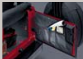
Aufbewahrungstasche Schwarz, für Hecktür, mit Unterteilung, Art.-Nr. 82202391