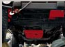
Schutzplatte Zum Schutz des Lenkgetriebes bei hartem Offroad-Einsatz, Artikel-Nr. 82204732