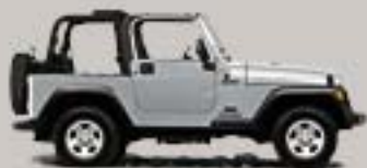
Bright Silver Metallic