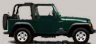
Deep Beryl Green Metallic 9