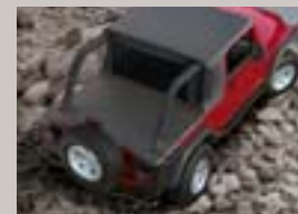
Abdeckungen Set bestehend aus „Bikini-Top“, Windschott und Heckabdeckung, Artikel-Nr. 82207739